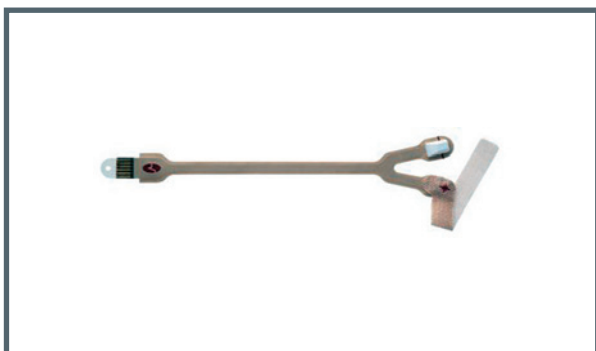
oryginalne czujniki Masimo